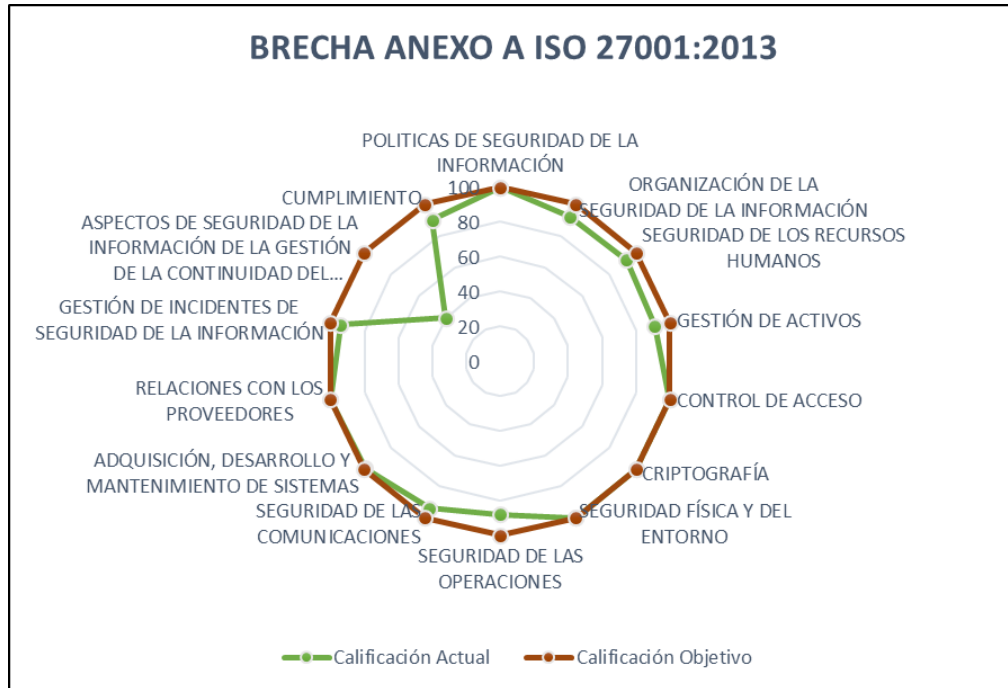
Ilustración 1. Comparativo de cumplimiento de los controles del Anexo A, de la ISO 27001:2013.

De otro lado el plan alcanzó un nivel de ejecución satisfactoria del 87,27%, sobre el total de las actividades formuladas y del 96% sobre la meta mínima establecida, así alcanzando el cumplimiento de la mayoría de las actividades.