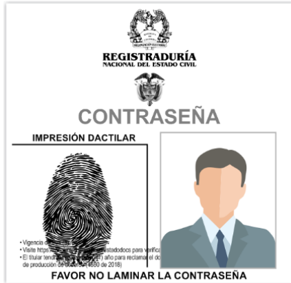
Contraseña y comprobante del documento en trámite