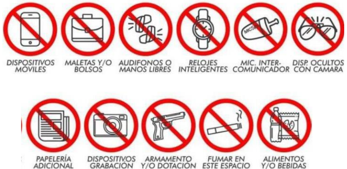
Ilustración 3 Prohibiciones durante la jornada de acceso

Nota: Es responsabilidad absoluta del aspirante el cuidado de los elementos adicionales que lleve consigo a la jornada de acceso al material de pruebas, la Universidad Libre y la CNSC no responderán por daños o pérdida de estos elementos.