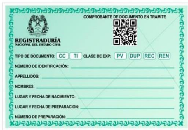
Ilustración 2. Contraseñas válidas para identificación

Adicionalmente, se debe verificar la fecha de las contraseñas debido a que estas tienen una vigencia de seis (6) meses, es importante mencionar que los pasaportes tienen fecha de vencimiento, por lo tanto, si este documento no se encuentra vigente no se considerará válido, por lo tanto, si el aspirante no se identifica con alguno de los documentos válidos antes referidos, NO podrá ingresar al salón ni acceder al acceso del material de las pruebas de ejecución.