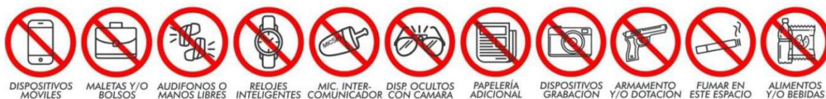
Ilustración 3 Prohibiciones durante la jornada de acceso

Durante la jornada se realizarán verificaciones o auditorias aleatorias frente al cumplimiento del NO uso de celular o cualquier otro accesorio electrónico o de comunicación y demás elementos prohibidos. Por lo anterior, el personal encargado podrá solicitar al aspirante mostrar los elementos con los que cuente en sus bolsillos, así como el retiro de gorras, recoger el cabello y visibilizar sus orejas, antebrazos y tobillos.