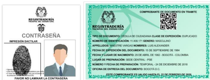
Ilustración 5 Contraseña válida para identificación

En caso de pérdida de la Cédula de Ciudadanía amarilla con hologramas, se permitirá el ingreso con la contraseña de la Registraduría Nacional del Estado Civil vigente, en cualquiera de los siguientes formatos (Ilustración 5):