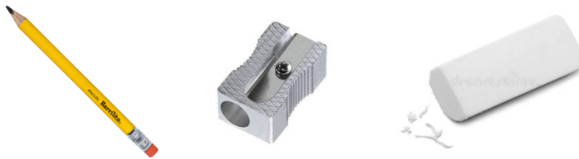
Ilustración 6 Elementos para diligenciar las pruebas