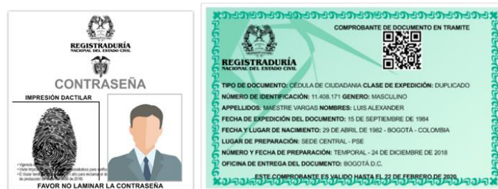
Ilustración 2 Contraseña válida para identificación

En caso de pérdida de la Cédula de Ciudadanía amarilla con hologramas, se permitirá el ingreso con la contraseña de la Registraduría Nacional del Estado Civil vigente, en cualquiera de los siguientes formatos (Ilustración 2):