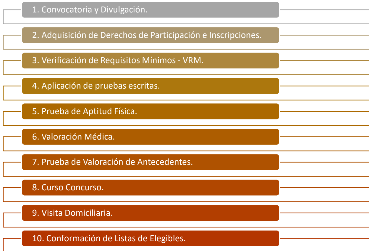
Ilustración 1 Etapas del Proceso de Selección