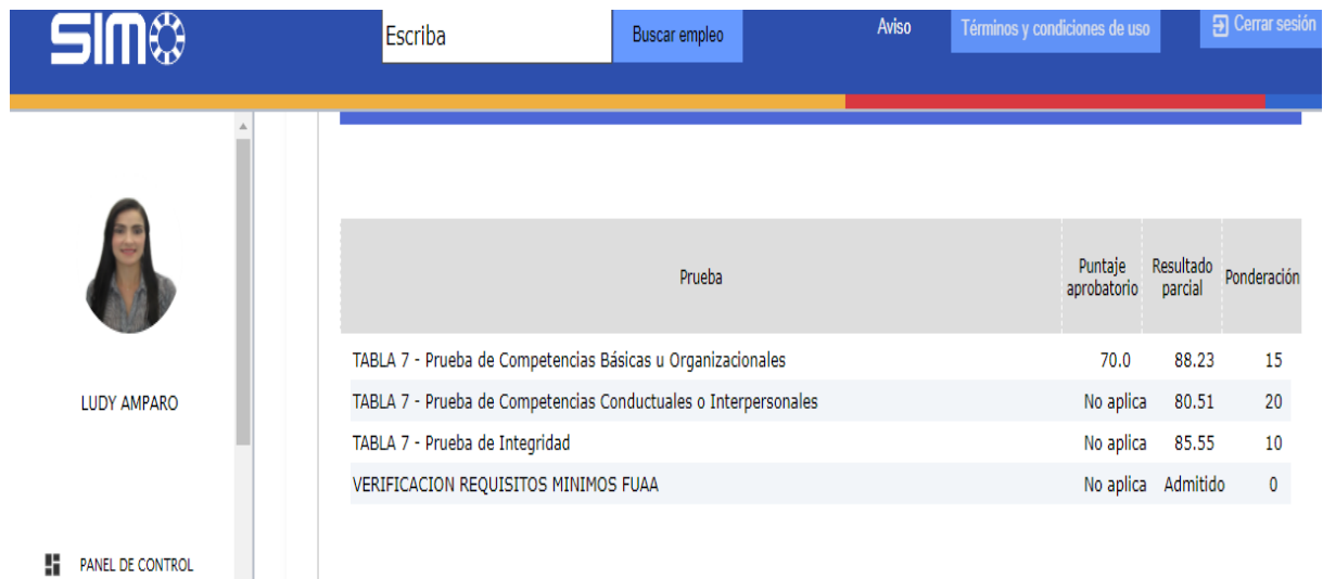
Imagen 1. Sumatoria de puntajes obtenidos – OPEC 198368

Mi número de inscripción en el concurso es el 597266130, así: