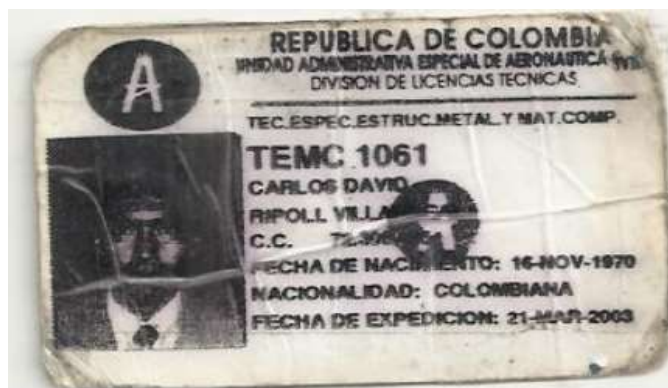
Copia del certificado b) allegado en término al aplicativo SIMO