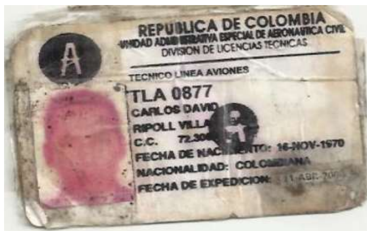
Copia del certificado c) allegado en término al aplicativo SIMO