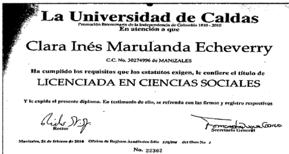
Imagen Diploma Licenciatura en Ciencias Sociales

Proyecto Educativo del programa de Licenciatura en Ciencias Sociales de la Universidad de Caldas. Vicerrectoría académica 2015.