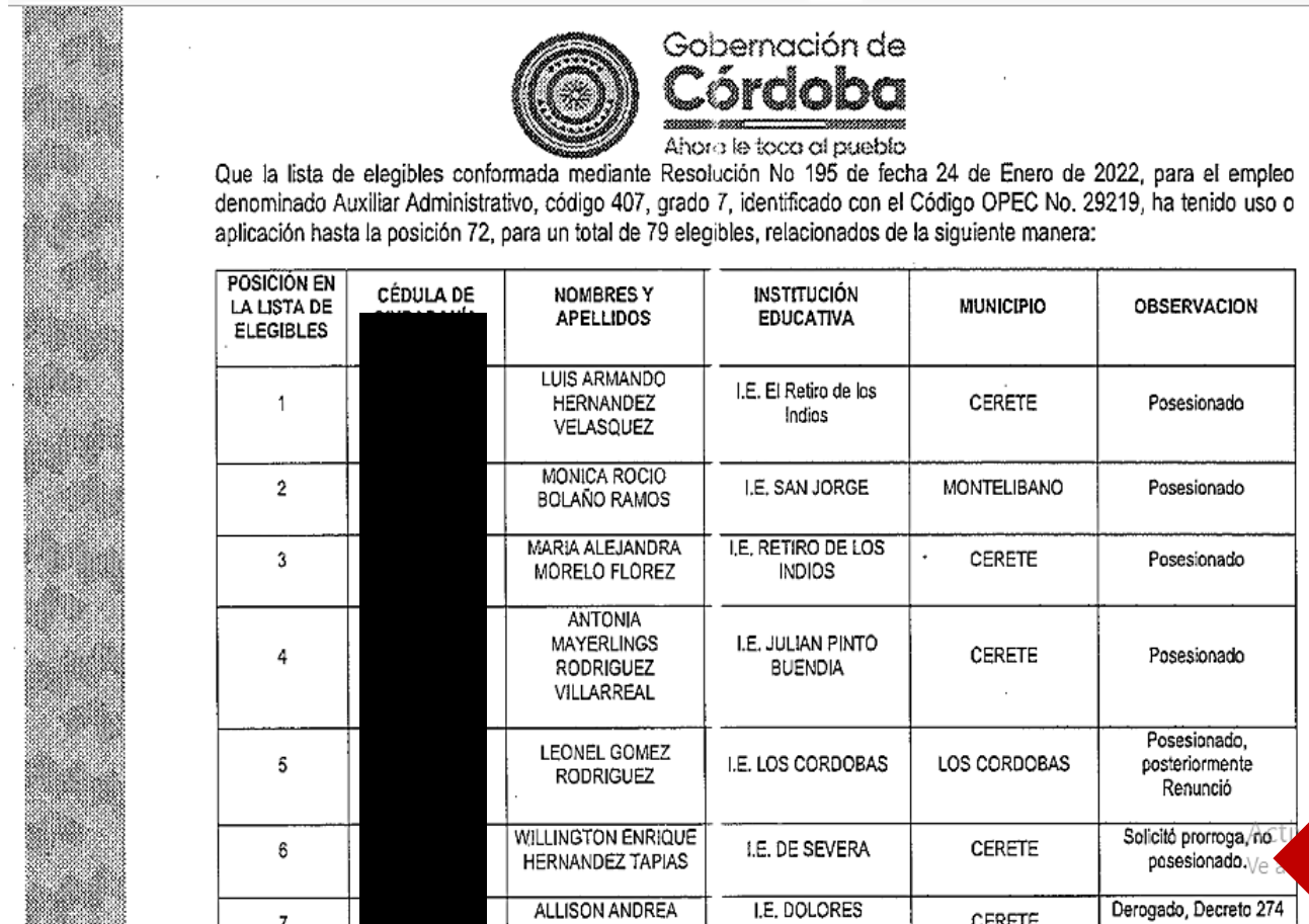
Imagen 4. Hoja 2 Oficio de Respuesta SED Córdoba 006292.

13. Que esta misma vacante definitiva cambia su estatus una vez es llamado a nombramiento en período de prueba del elegible que la escogía en la AUDIENCIA DE ESCOGENCIA DE PLAZAS , la cual inicialmente fué virtual a través del aplicativo SIMO y luego en una audiencia pública realizada por la SECRETARIA DE EDUCACIÓN DEPARTAMENTAL - GOBERNACIÓN DE CÓRDOBA , quedando con el estatus de DESIERTA como se muestra en el OFICIO DE RESPUESTA DE LA SED Córdoba 006292 emitido el 20 de noviembre de 2023.