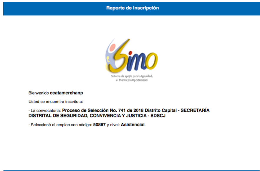
Imagen N° 1. Inscripción a la convocatoria.

1. Me encuentro inscrita dentro de la convocatoria No 741 de 2018, cuyo número del empleo CNSC es el 50867, el código del empleo es el 407, Grado 19 y cuya denominación es AUXILIAR ADMINISTRATIVO.