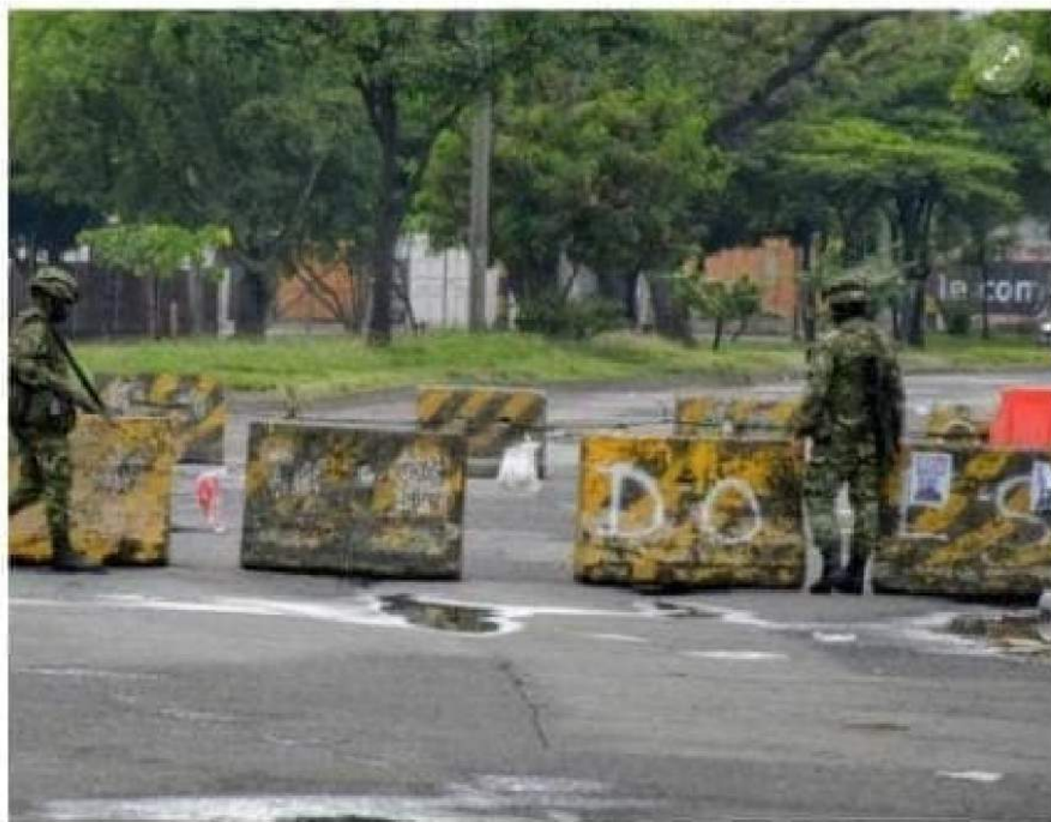
Imagen de referencia. En alrededor de 16 puntos de la ciudad hay presencia de manifestantes o escombros que impiden el tránsito vehicular.

Este es el reporte del estado actual de las vías de Cali, entregado por la Secretaría de Movilidad a la 1:00 p.m.: