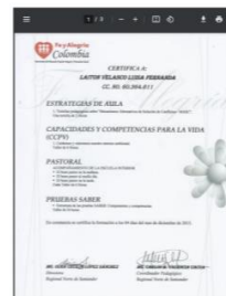
Pantallazo de folio No. 4