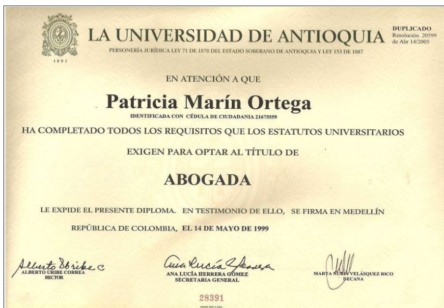
*Captura de pantalla del aplicativo SIMO de la aspirante.

Al respecto se considera necesario indicar que el título profesional puede ser acreditado con el respectivo diploma o Acta de Grado, Tarjeta Profesional o Certificado de Existencia del Título expedido por la institución educativa competente, tal como lo dispone el artículo 7º del Decreto Ley 785 de 2005, en concordancia con lo señalado en el artículo 14 del Acuerdo 20191000001096 del 04 de marzo de 2019, y que en su tenor literal señalan: