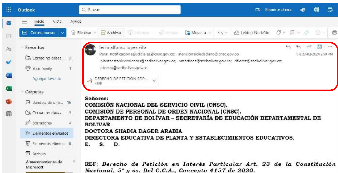
Pantallazo No 1: Derecho de petición vía correo electrónico. El día viernes 23 de febrero de 2024 a las 3:50 p.m.