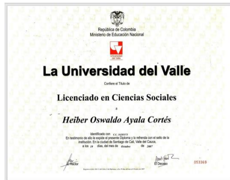
Imagen 1. Diploma título en Licenciatura en Ciencias Sociales - Universidad del Valle

Considerando lo anterior y como se puede observar en la imagen tomada el 31 de mayo de 2023, el programa de Licenciatura en Ciencias Sociales de la Universidad del Valle de la cual soy egresado y como se corroborar en los anexos de formación académica del presente concurso (ver imagen 1). en la Actualidad, el programa de Licenciatura en Ciencias Sociales cuenta con acreditación de alta calidad por parte del Ministerio de Educación Nacional según información obtenida en la página del SNIES (ver imagen 2).