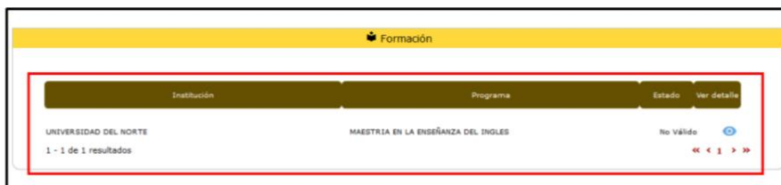
Imagen 1, único folio cargado en el módulo de formación