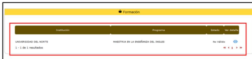
Imagen 1, único folio cargado en el módulo de formación