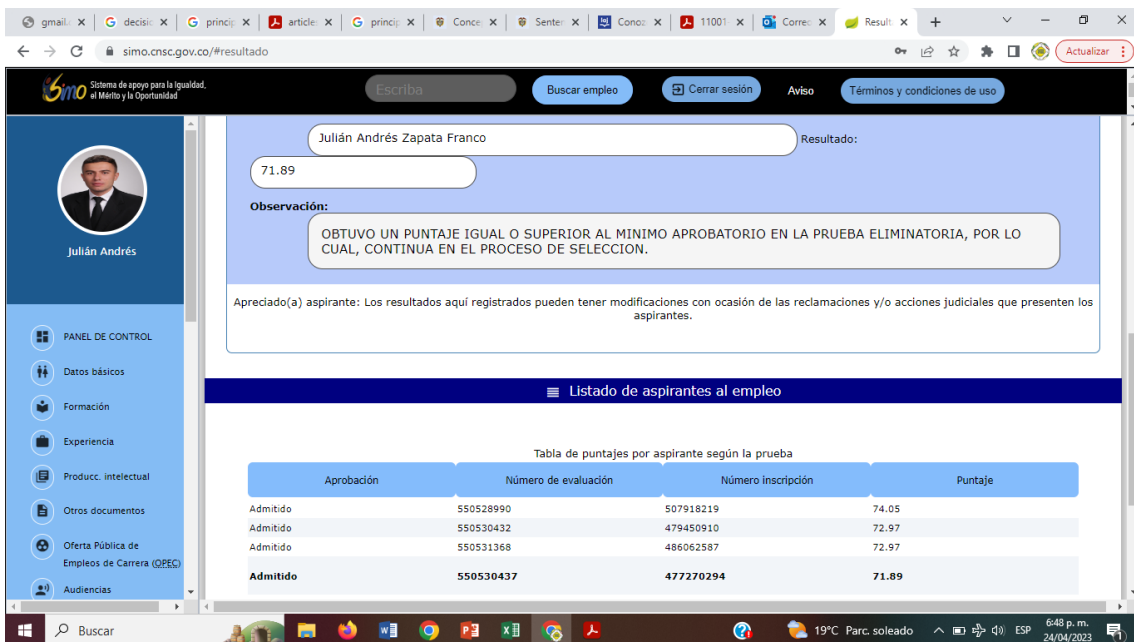
PANTALLAZO PUNTAJE PRUEBA DE CONOCIMIENTOS CUARTO LUGAR ADMITIDO