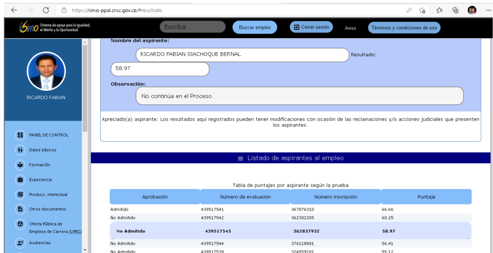
Figura 2. Resultados de las pruebas funcionales.