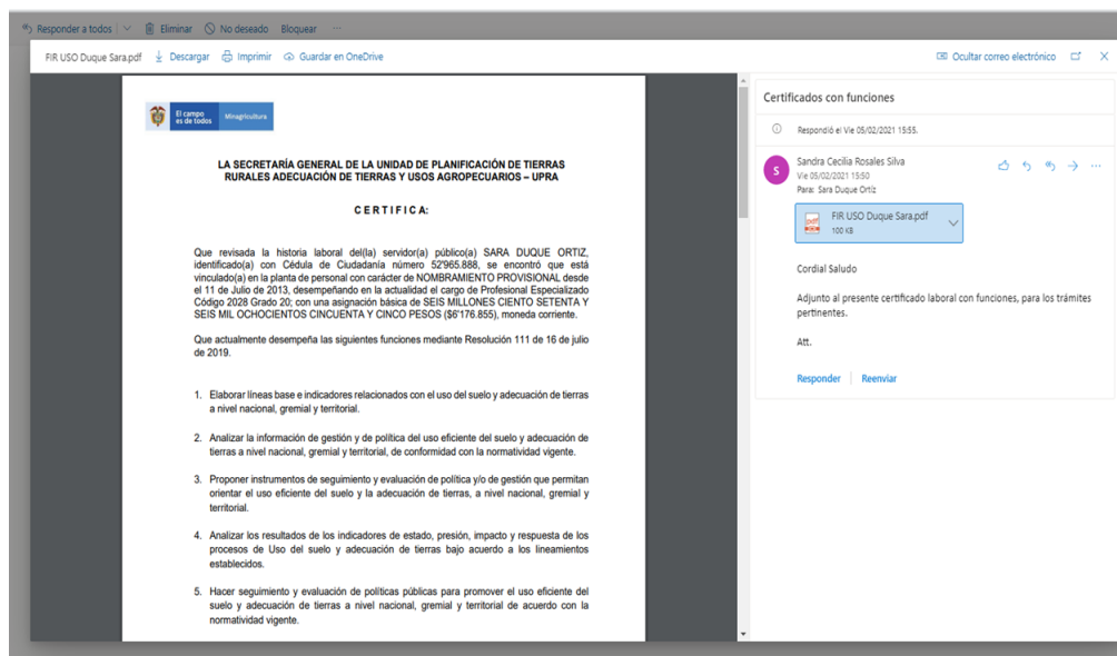
Figura 5. Correo electrónico enviado por a UPRA, con la certificación laboral que se anexó como soporte de la experiencia laboral en el concurso de méritos.